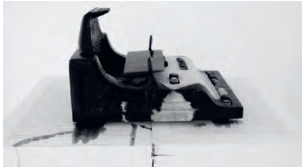
Abb./Fig. 1 Claudia Märzendorfer, music typewriter , 2018, Eisskulptur, Tinte, Notenpapier / Ice sculpture, Ink, Music paper

Mechaniken in Bewegung. Sie sind als funktionslos gewordene Maschinenteile und allein als Metaphern einer schöpferischen Taktilität präsent, die nunmehr auch ohne den Umweg der schon von Shakespeare erotisierten Tastatur 1 an die Plastizität des Korpus selbst delegiert ist: Die Notenschreibmaschine produzierte »autodestruktiv« (Gustav Metzger) monochromen Tachismus, das Klavier durch planvolle Attacken auf seinen Leib Töne, Geräusche, Krach. Nun also auf dem Pfefferberg Auflösungen der Instrumentarien mit Mitteln der Plastizität und des Expanded Cinema (vgl. die Abbildungen auf den Seiten 10–17).