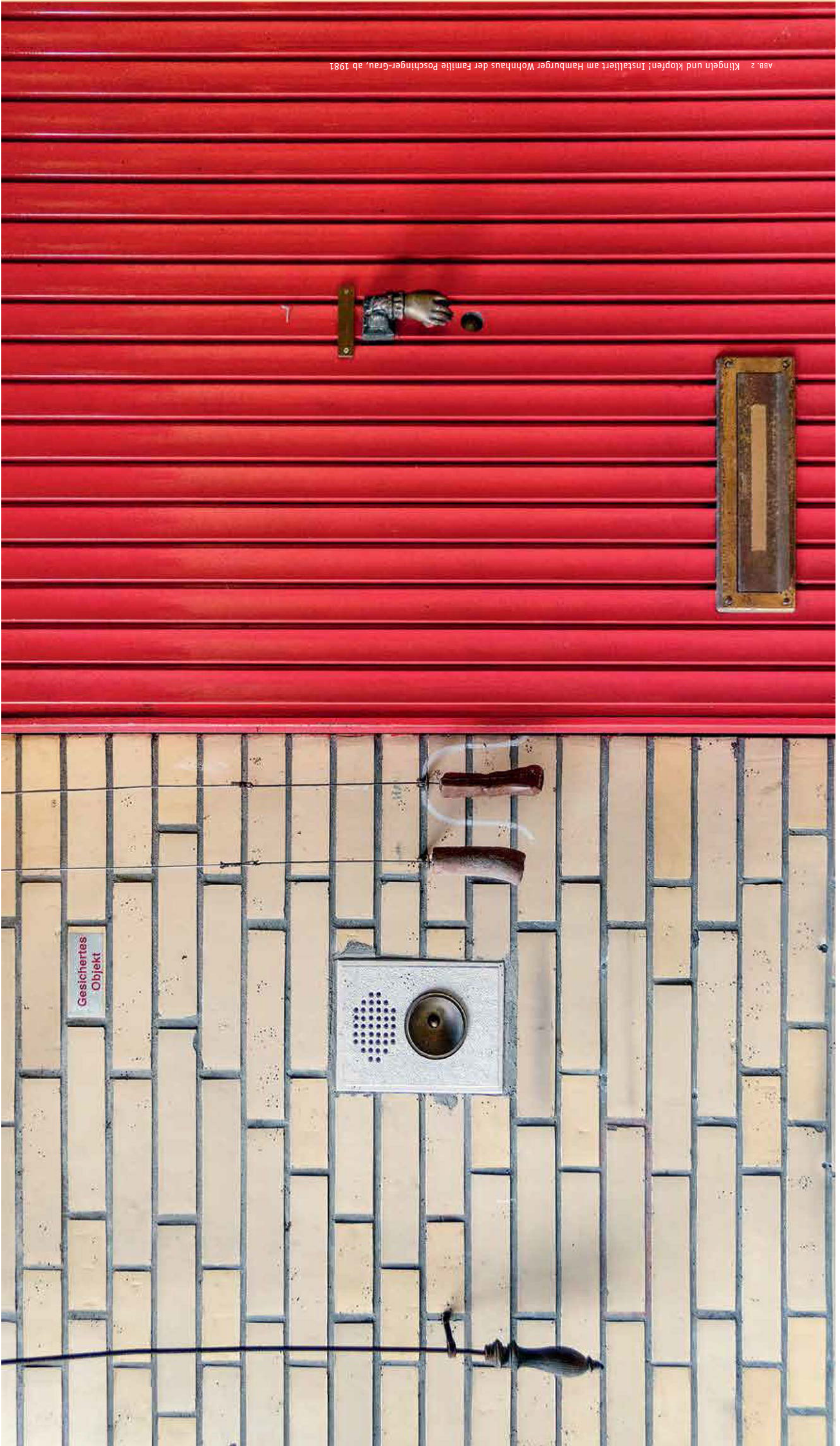
Abb. 2 Klingeln und klopfen! Installiert am Hamburger Wohnhaus der Familie Poschinger-Crau, ab 1981